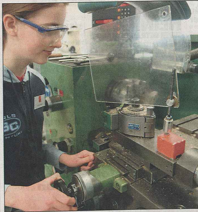
Ist oft hilfreich: ein Praktikum vor der Lehre.

Info: Auskünfte zum Prozedere bei der Arbeitsagentur gibt es unter der Arbeitgeber-Hotline 0 18 01-66 44 66 oder auf www.stuttgart.ihk.de , wo es ebenso Infos zur Einstiegsqualifizierung gibt.